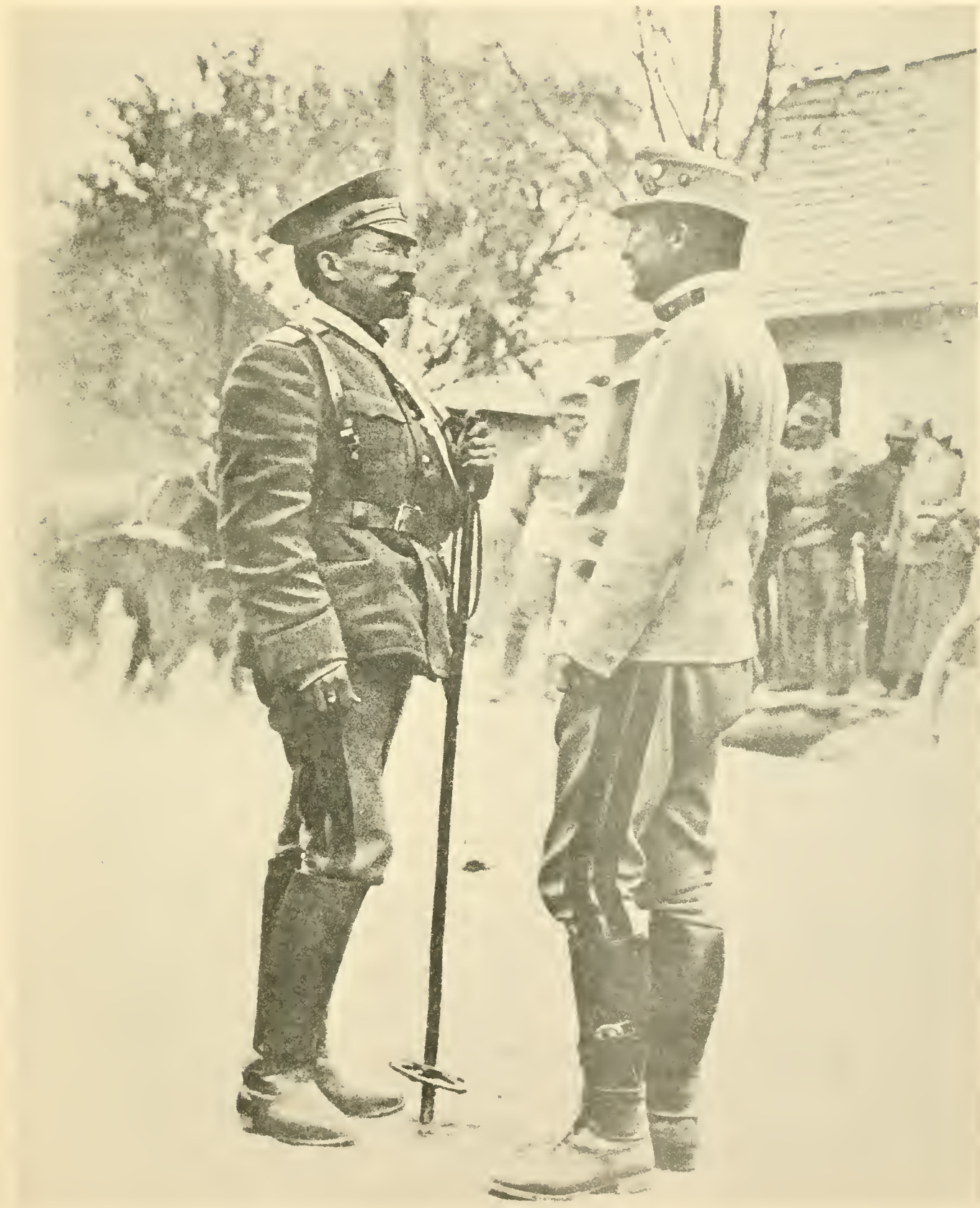
Главнокомандующий Венгерской Армии Эрцгерцог Иосиф Габсбургский разговаривает с пленным Генералом Корниловым /с редкого снимка сделанного в бытность его в Австро-Венгерском плену/